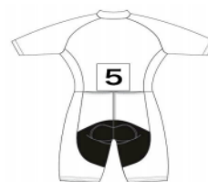
タイムトライアル系

・バイクチェックは、コースイン前のバイクチェックエリアで行う。 ・バンチレース競技では、選手はホームストレートからコースに入り、バックストレートからのみコースから出るものとする。200m タイムトライアルは、スタートした側からコースインする。